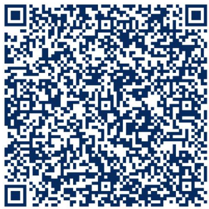
115學年高中部新生專區連結