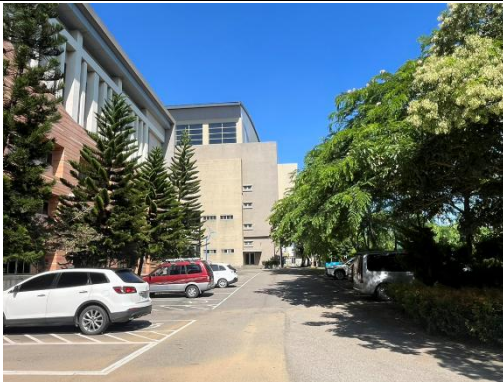
原校區汽車停車場