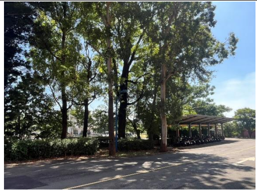
原校區機車停車區