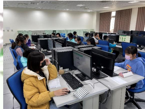
八年級適性化職涯性向測驗