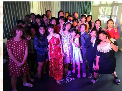
家政群體驗 (安和國中)