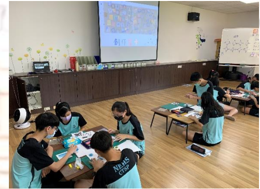
生涯議題融入輔導活動課 年度代表字