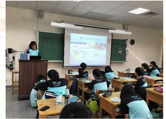
生涯議題融入輔導活動課 校系報告