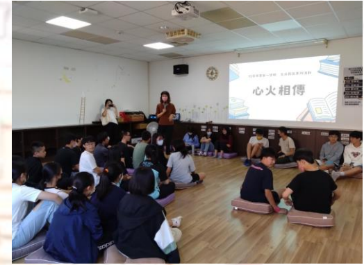
蒐集國三學弟妹的問題