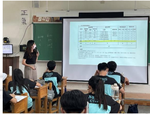
生涯議題融入輔導活動課 超額比序積分說明