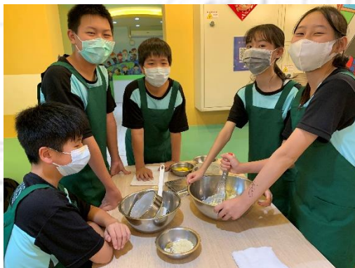
餐旅群體驗 (清水國中)