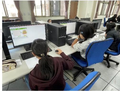
八年級適性化職涯性向測驗