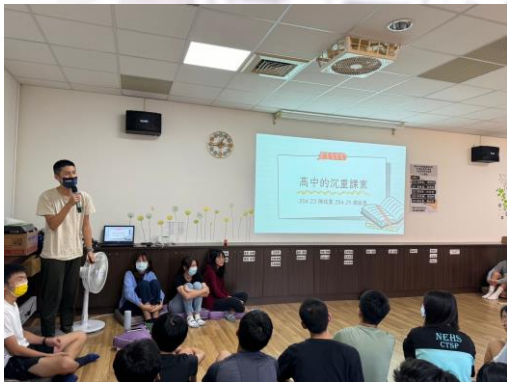
學長姐分享準備會考的心路歷程