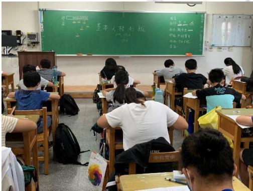
七年級學習策略量表