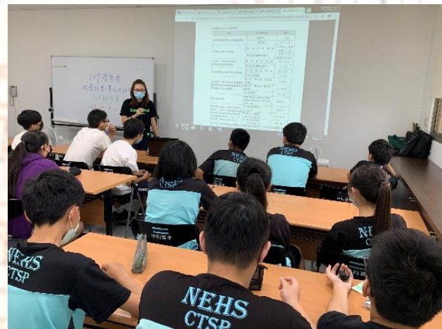
實用技能班+技優甄審說明