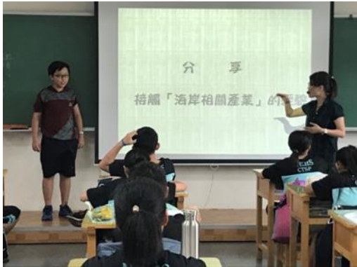
生涯議題融入地理課