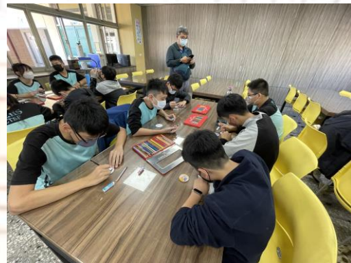
112-嶺東高中多媒體設計科