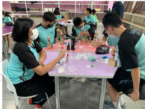
創課列車活動 創意轉動模型製作