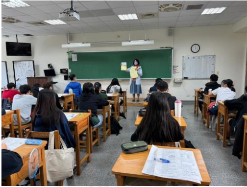
到班宣導心火相傳活動