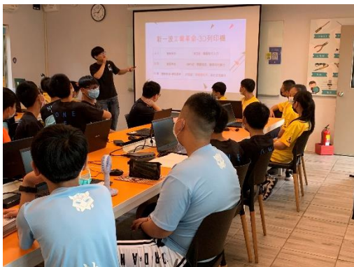
電機電子群體驗 (清水國中)