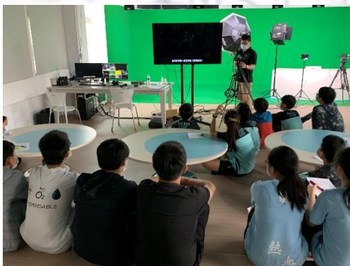
藝術群體驗 (安和國中)