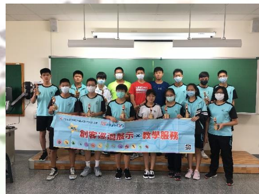
創課列車活動 創意轉動模型製作