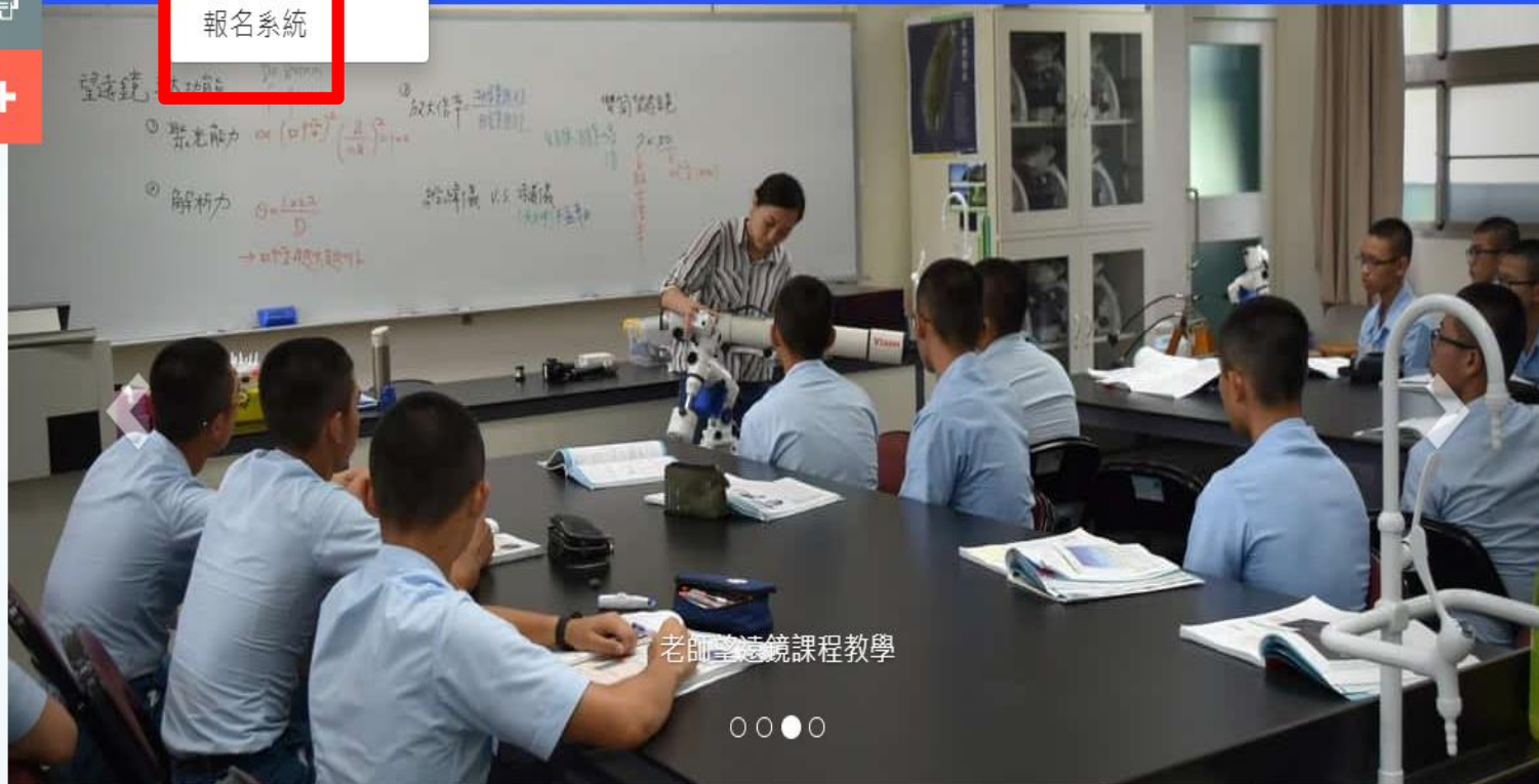
老師望遠鏡課程教學