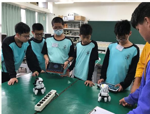
電機電子群體驗 (東勢高工)