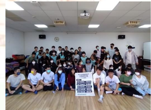
心火相傳活動大合照