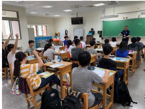
高中職校系入班宣導