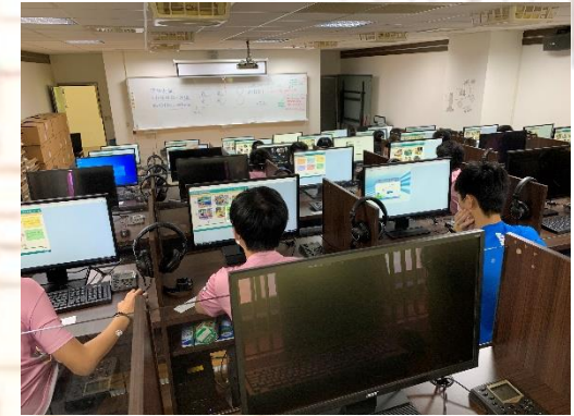
九年級情境式職涯興趣測驗