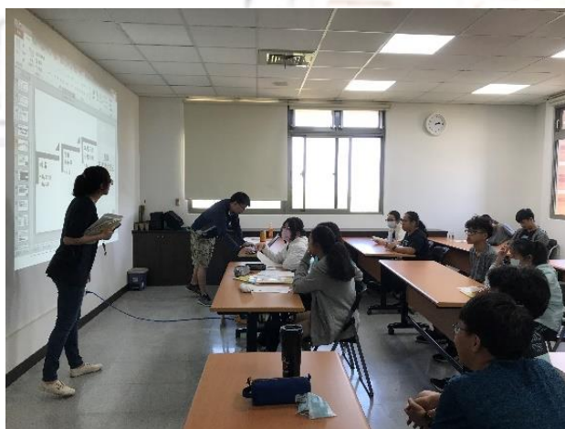
五專免試入學說明