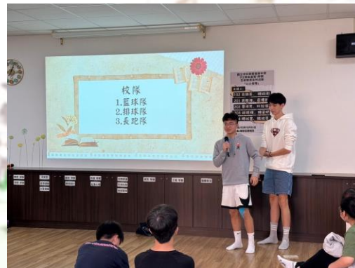
學長姐介紹高中部的生活