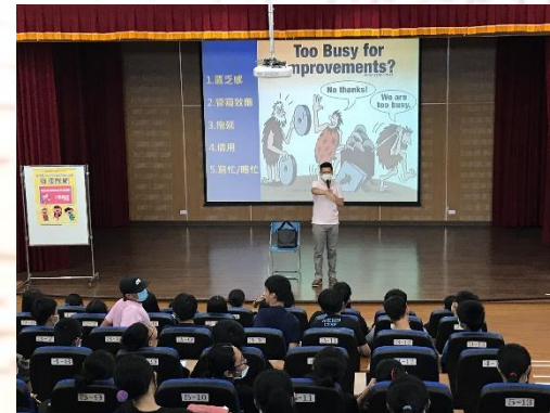
生涯探索暨就業知能講座