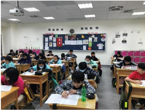
七年級賴氏/基本人格測驗