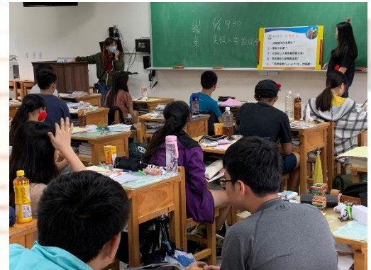
高中職校系入班宣導