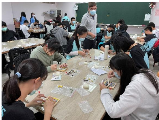
110-明台高中室內設計科