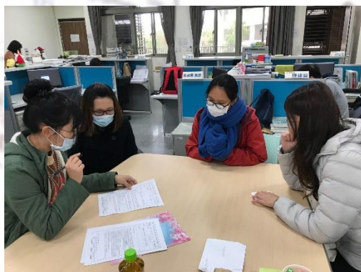
綜合活動領域會議