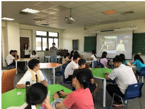
創課列車活動-馬克杯