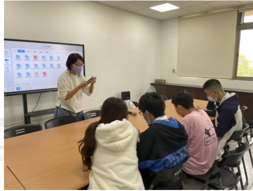
召集直升高中的學長姐