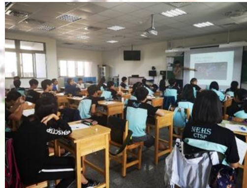
生涯議題融入數學課