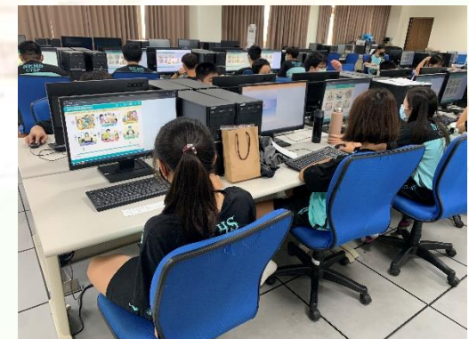
九年級情境式職涯興趣測驗