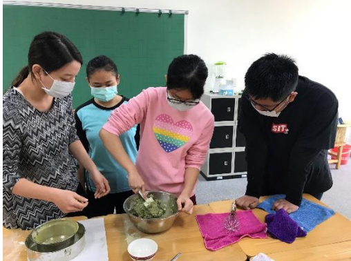
生涯議題融入特教烘焙課程