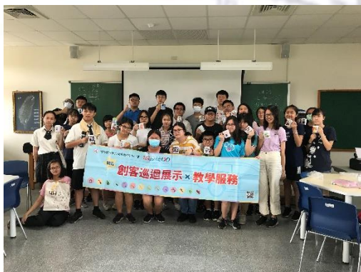
創課列車活動-馬克杯