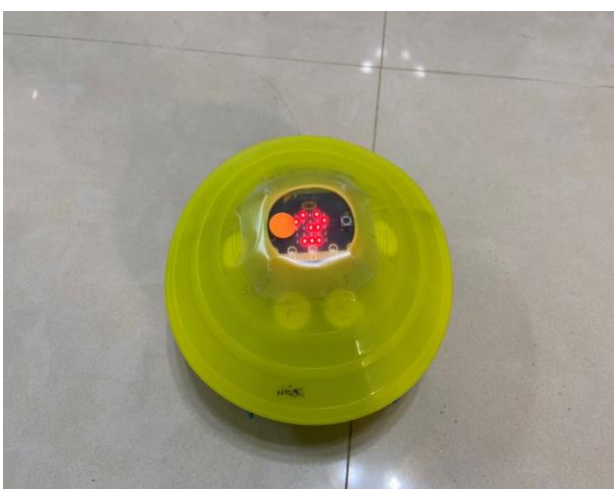
不定向反應訓練計分裝置