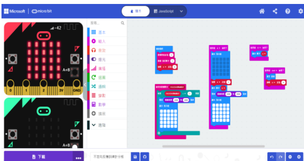
不定向反應訓練計分裝置程式

十六、 聯絡方式：中心專線：04-25255702，電子信箱：tc.maker@fcps.tc.edu.tw