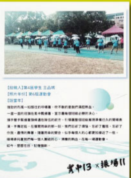
實中13 X 操場11