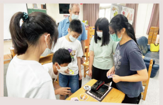
▲桌遊社團遊戲策略研商中