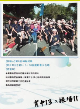
實中13 X 操場11